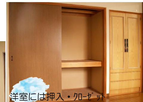
洋室には押し入れ・クローゼット