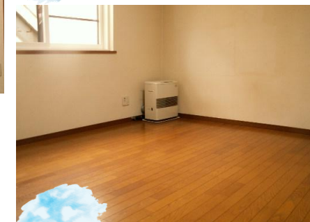
LDKにはストーブとエアコンを完備