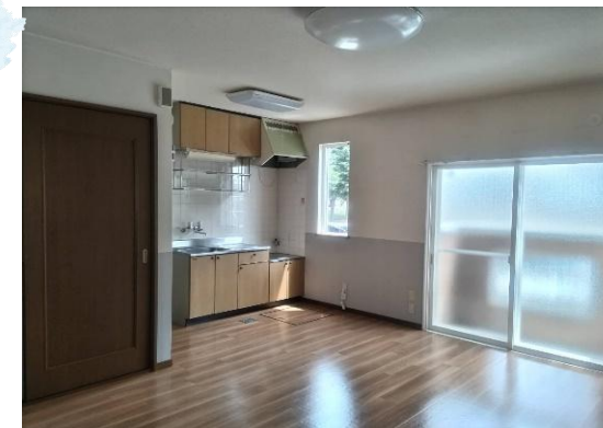
明るいLDKにはストーブ完備