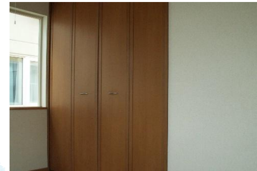
LDKにはストーブとエアコンを完備