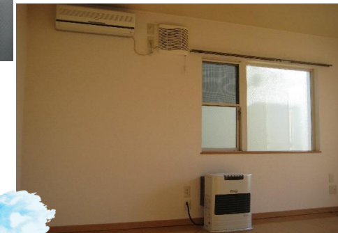
LDKにはストーブとエアコンを完備