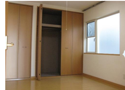
広々収納のクローゼット