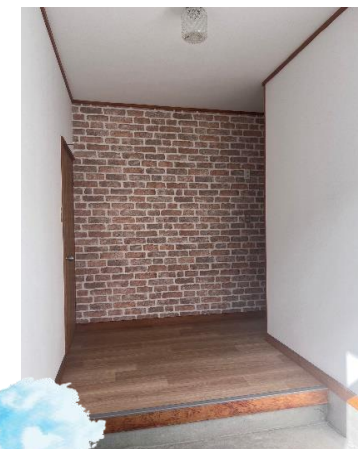
ゆとりのある玄関